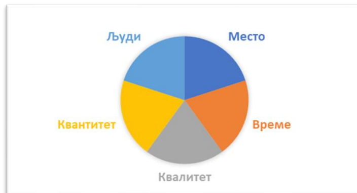
Дијаграм 1. Структура доброг индикатора

У табели број 2 у наставку представљамо „матрицу за добар индикатор“. На овај начин само желимо да укажемо на један од могућих путева како је могуће представити циљеве у једној политици, програму или пројекту на начин да буду разумљиви, како за реализаторе тако и за јавност 4 .“